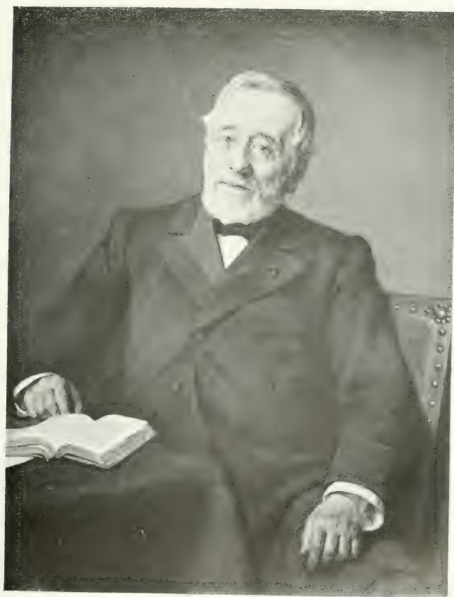
Guillaume TIBERGHIE RECTEUR EN 1867-68 ET EN 1875-76 décédé le 28 novembre 1901.